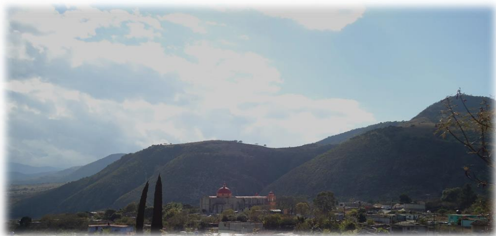
Fotografía 3.1. Vista de la comunidad de San Miguel Tlacotepec. Al fondo se observa el cerro de las calaveras.

Es de suma importancia clarificar la división político-administrativa entre los términos cabecera municipal y municipio. El primero designa la sede del gobierno local y una localidad específica