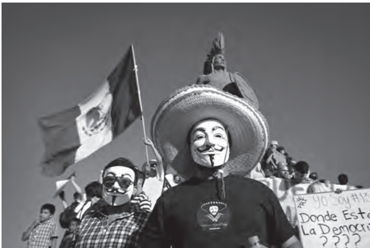
Marcha por la defensa del voto ciudadano y antiimposición