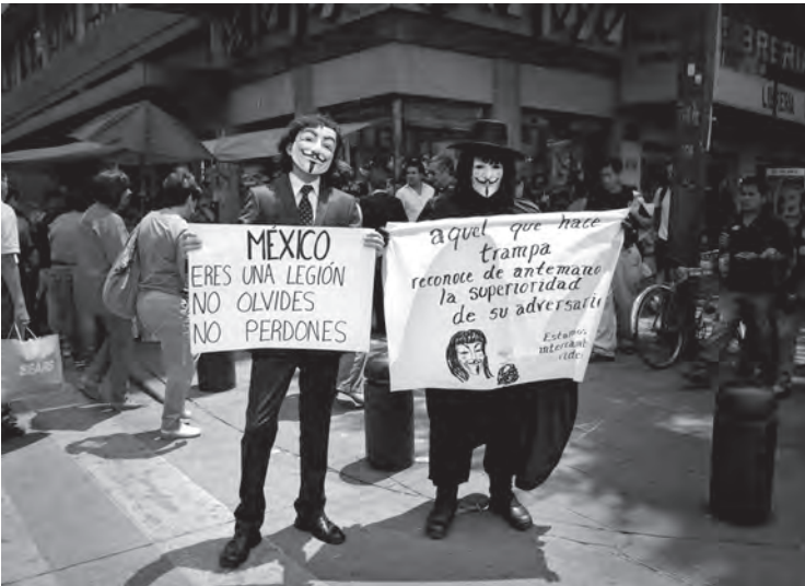
Herederos del anonimato. Mega Marcha antiimposición