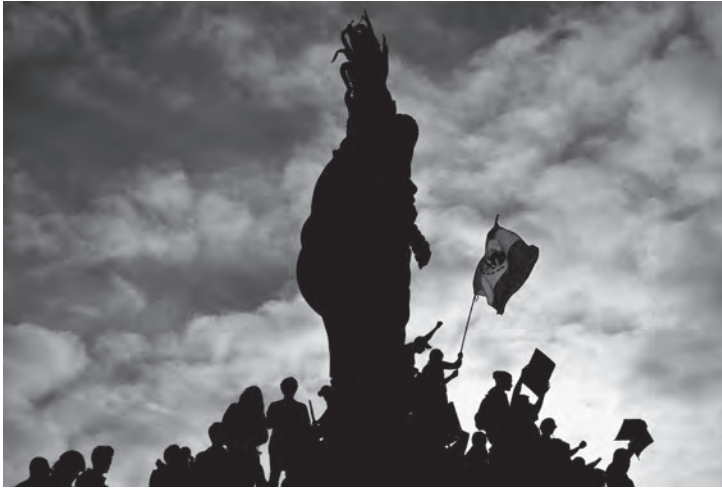
De la mano de los gigantes. Marcha por la defensa del voto ciudadano y anti imposición