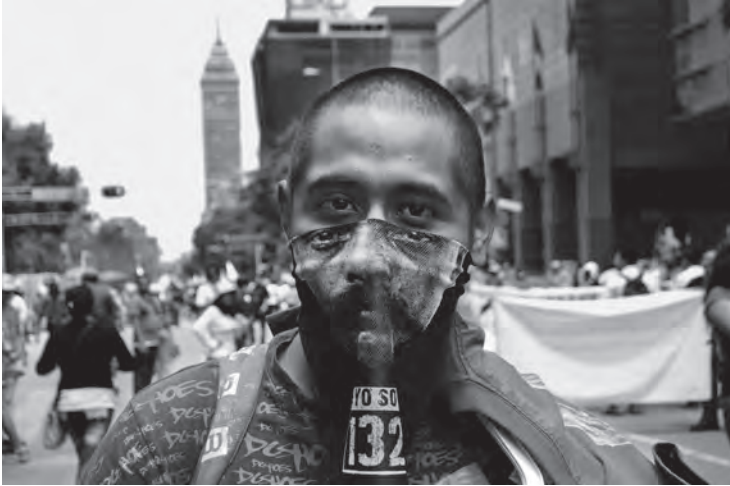
Yo soy Zapata. Mega Marcha antiimposición