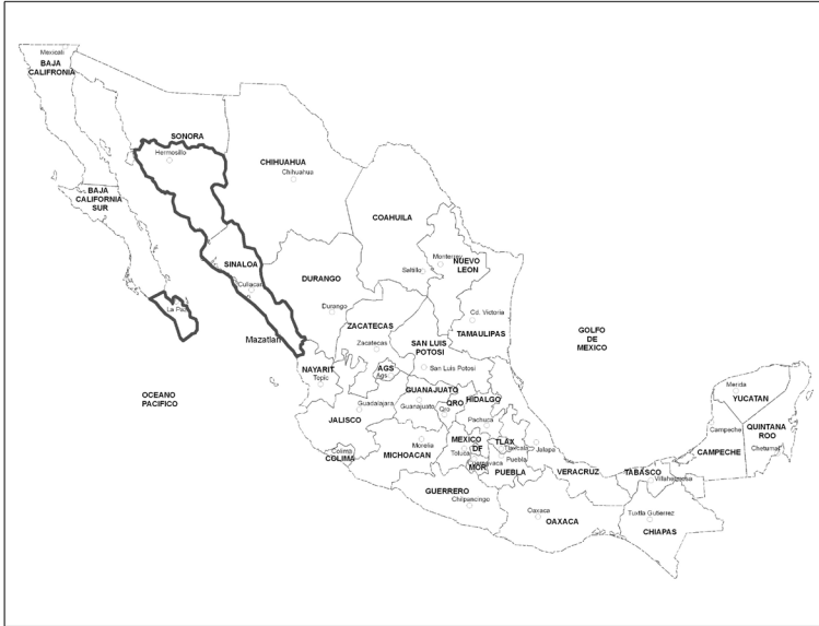
MAPA 1. Área de influencia del comercio de Mazatlán durante el Porfiriato