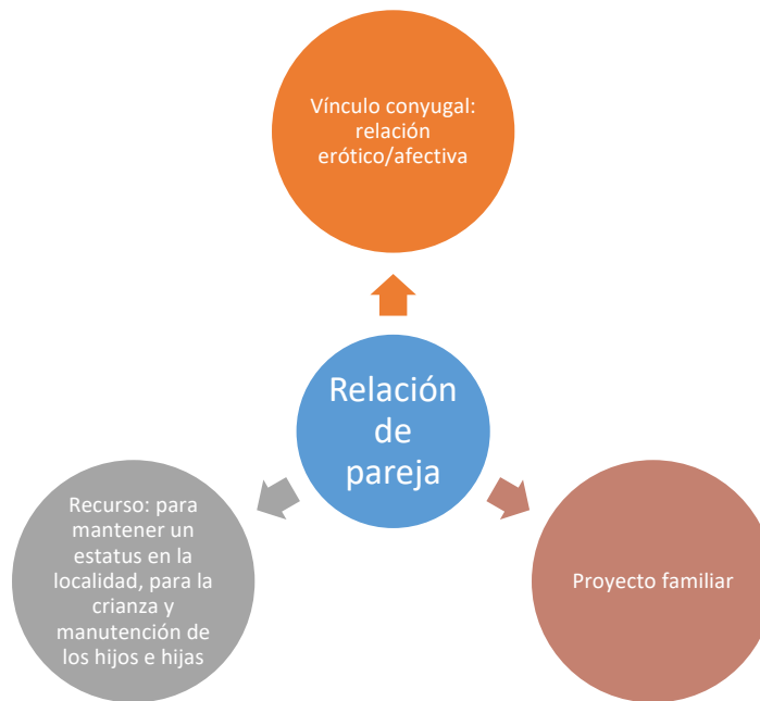
Figura 2. Esquema propuesto sobre el papel de la pareja en la vida de las mujeres

Para las mujeres entrevistadas, la relación de pareja es importante porque es una relación de amor, cariño y afecto en la que comparten una vida sexual activa. Por otro lado, la pareja desempeña un papel fundamental para el cumplimiento del proyecto familiar puesto que es un proyecto común. Finalmente, ellas consideran que la pareja es también un recurso que puede fungir de apoyo de diferentes formas. A continuación, se propone un esquema (figura 2) para ejemplificar cómo es que estas mujeres conciben la relación de pareja.